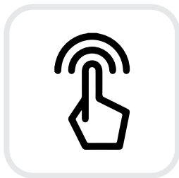
LCD Touch Screen