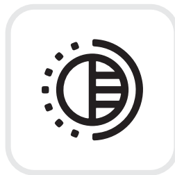
Pengaturan Intensitas Cahaya